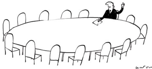
"It looks like we have a consensus."